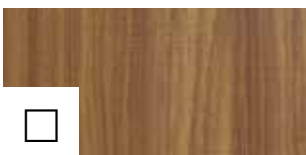
ORECH ECO top